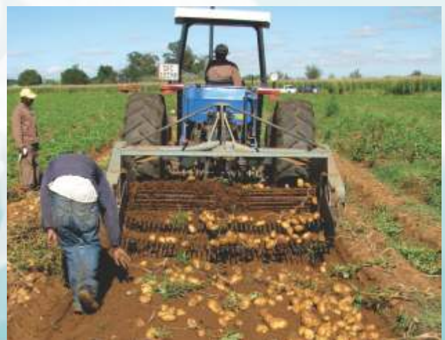
Uithaal van die kultivarproef te Middelburg